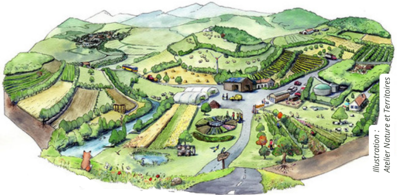
Illustration : Atelier Nature et Territoires